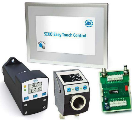
Das Siko HMI ETC5000 ermöglicht einfaches Retrofit durch Plug & Play Komponenten.

Intelligente Kompaktstellantriebe sind somit für alle Anwender die erste Wahl wenn besonders häufig Formatverstellungen durchgeführt werden und hohe Qualitätsansprüche gestellt werden. Sie sind für heutige und zukünftige Maschinenkonstruktionen unerlässliche Industrie 4.0 Komponenten.