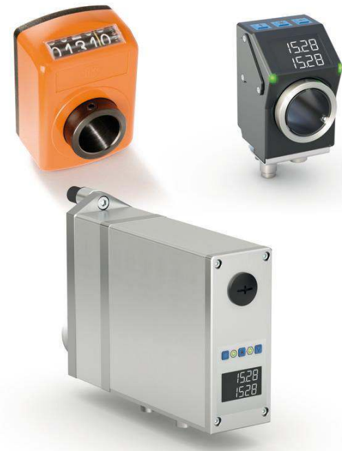
Mechanische Positionsanzeige DA09S, elektronische Positionsanzeige AP05 und Kompaktstellantrieb AG24.

Die fortschrittlichen Kompakt-Positionierantriebe sind trotz kompaktester Abmessungen bis zu einem Drehmoment von 14 Nm (Typ AG24) erhältlich. Die Antriebe verfügen über eine Hohlwelle mit Klemmring für eine einfache und schnelle Montage.