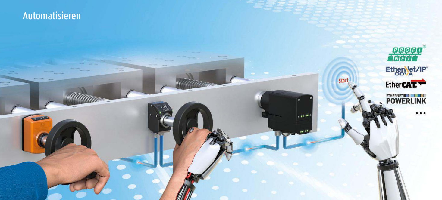
Smarte Positioniersysteme für Industrie und Maschinenbau.