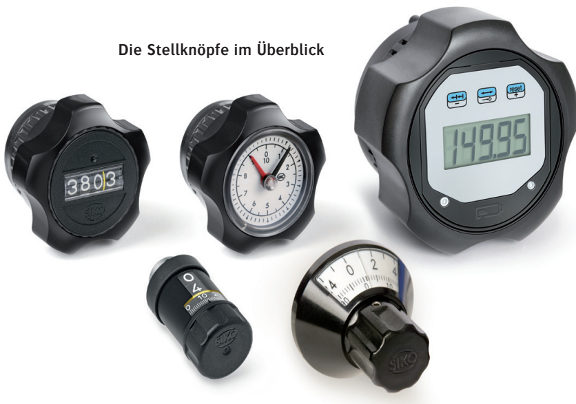
Die Stellknöpfe im Überblick

Allen Stellknöpfen gemein ist die rückseitige Drehmomentstütze. Dieser Kunststoffpin ermöglicht den Einbau der DK in jeglicher